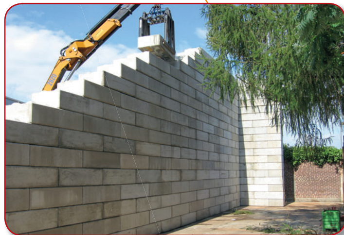
Legioblock® als Trennwand

Legioblöcke® haben eine kurze Lieferzeit und werden bei der Lieferung direkt vom Fahrzeug aus aufgebaut. Für den Bau mit Legioblöcken® ist ein ebener und tragfähiges Untergrund die einzige Voraussetzung. Nach dem Aufbau